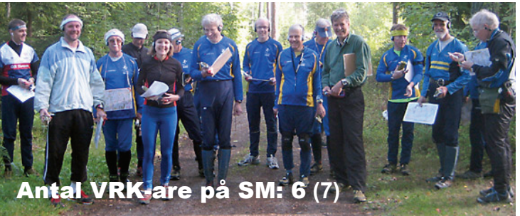
Antal VRK-are på SM: 6 (7)