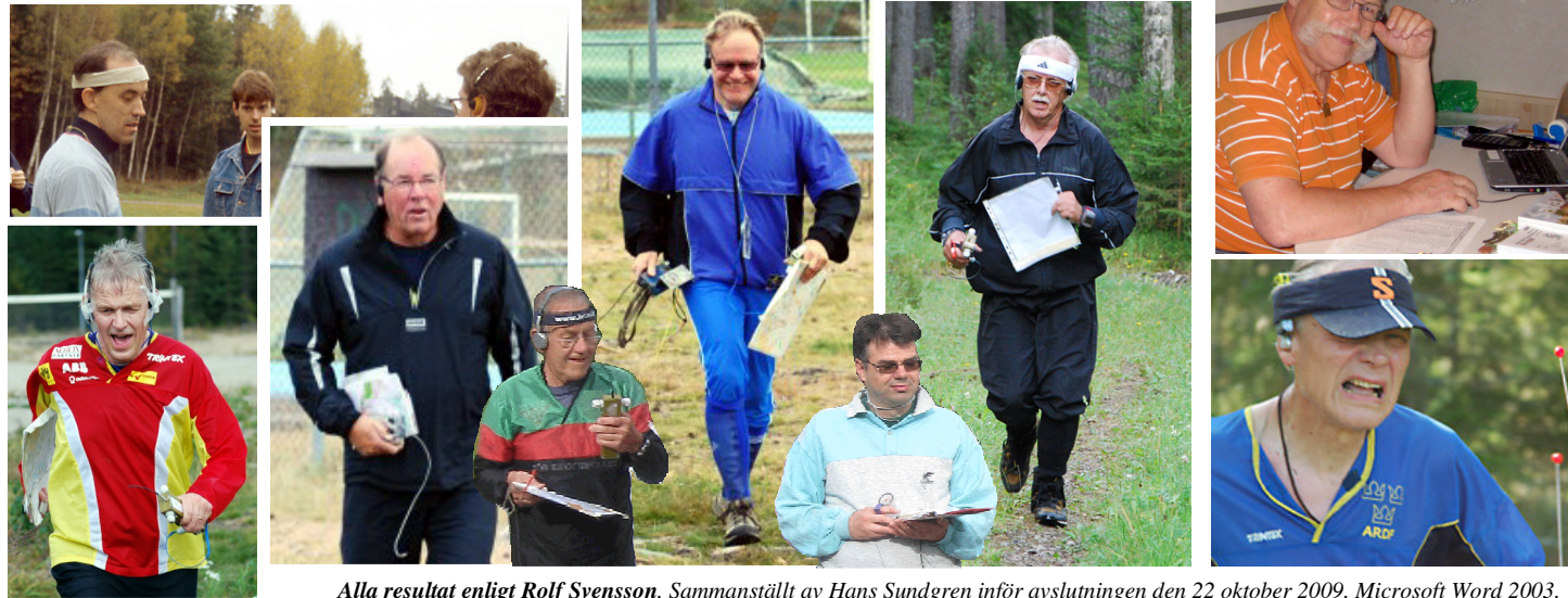
Alla resultat enligt Rolf Svensson. Sammanställt av Hans Sundgren inför avslutningen den 22 oktober 2009. Microsoft Word 2003.